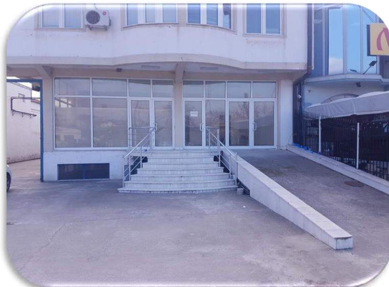
Слика 4: Влез во изложбениот салон

Снабден е и со рампа за полесен пристап на возила.