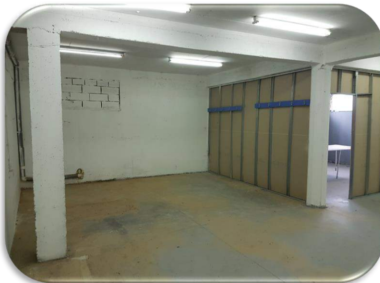
Слика 15: Работна просторија 2