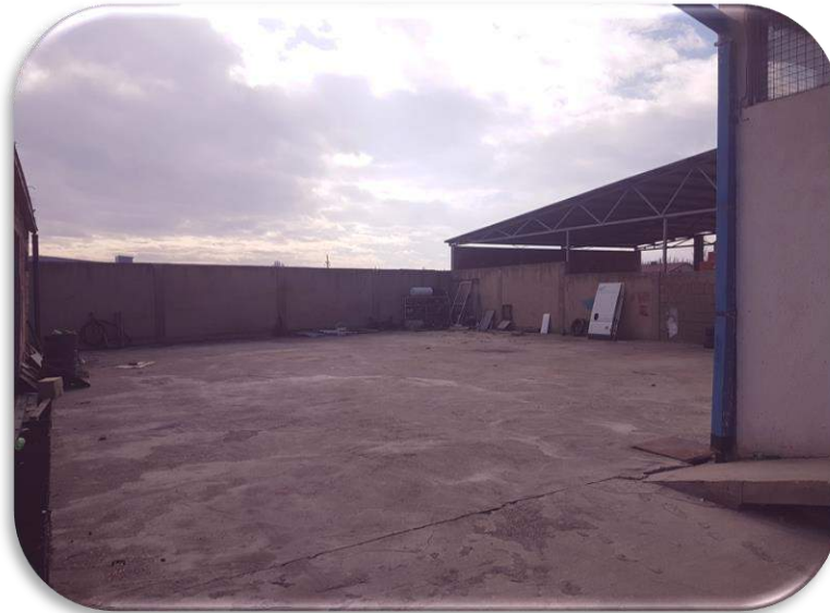
Слика 3: Паркингот што се наоѓа позади објектот