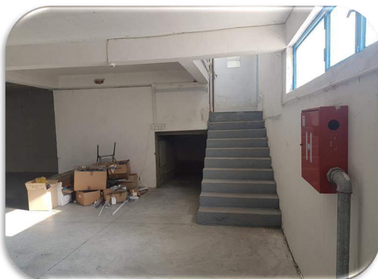
Слика 12: Поврзување на работната просторија 1 со задниот паркинг и тоалетите