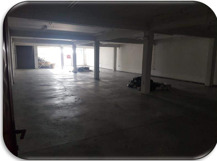
Слика 8: Работна просторија 1

На долниот кат од објектот се наоѓа работната просторија 1 која зазема површина од 300m 2 . Просторијата има тоалети и канцеларија . Канцеларијата е достапна и преку посебен влез. Овој дел на објектот е достапен преку задниот паркинг и од внатрешноста на објектот. Работната просторија 1 и работната просторија 3 (приземје) се поврзани со товарен лифт.