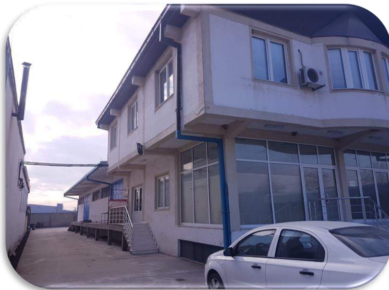
Слика 2: Пристап до задниот дел на објектот