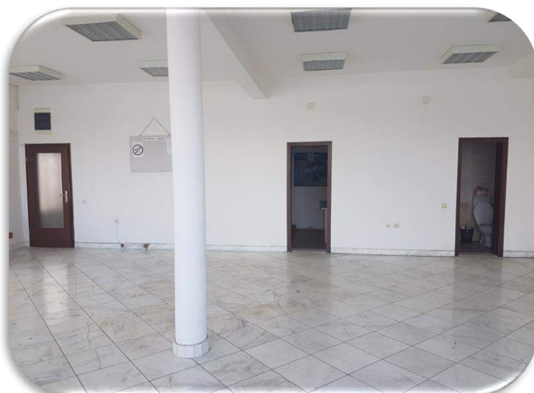
Слика 7: Изложбен салон - помошни простории и пристап до другите делови на објектот