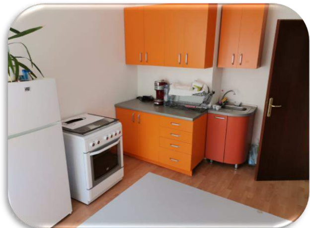
Слика 22 и 23: Канцелариски простор со приемен дел