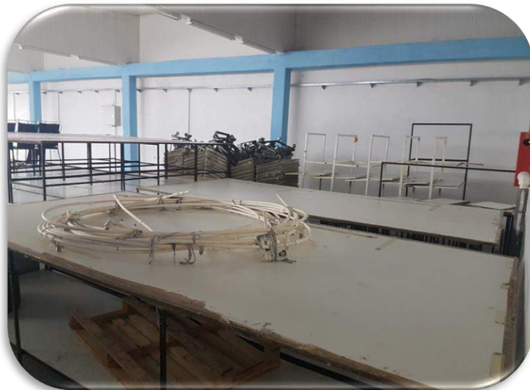
Слика 18: Работна просторија 3