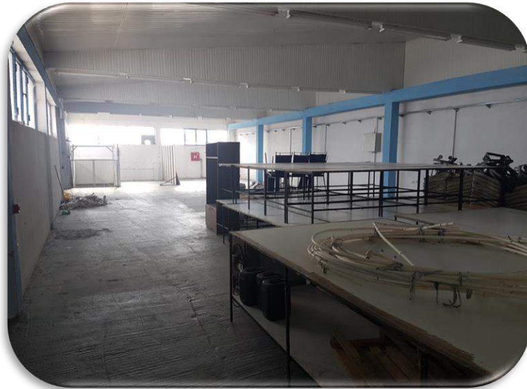
Слика 17: Работна просторија 3