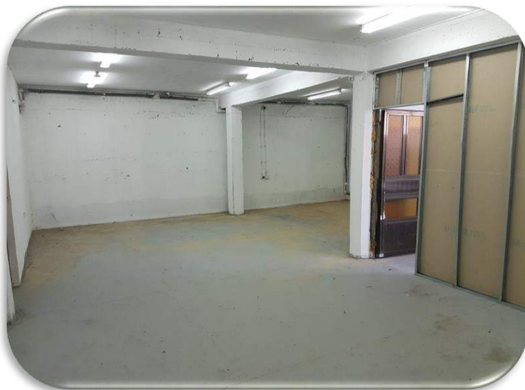
Слика 14: Работна просторија 2

На долниот кат се наоѓа и втората работна просторија која има површина од приближно 100\text{m}^2 . Од оваа просторија е достапна канцеларијата на работната просторија 1.