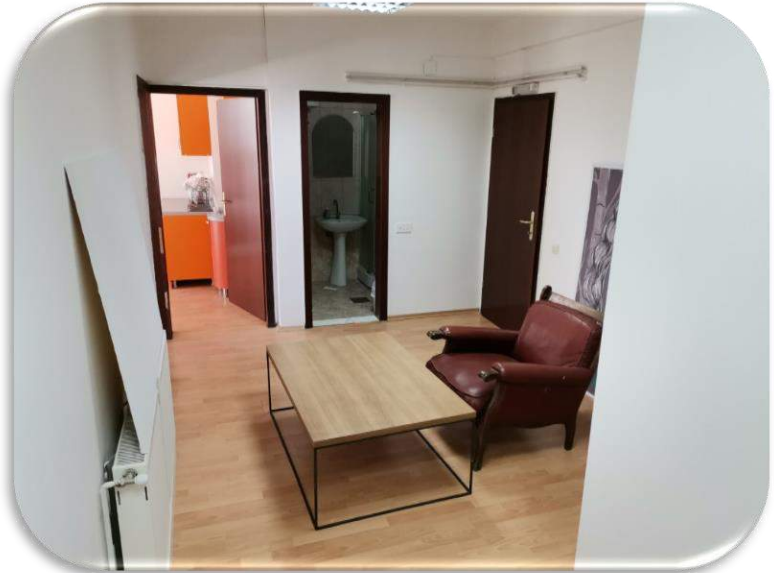
Слика 20 и 21: Канцелариски простор со приемен дел