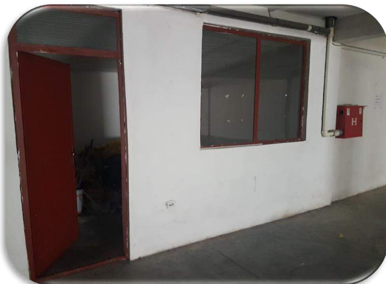
Слика 11: Канцеларијата на работната просторија 1