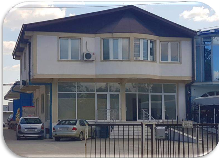
Слика 1: Поглед на објектот и предниот паркинг

Деловниот објект вклучува сопствен двор со паркинг со вкупна површина од 300m 2 . Паркингот е поделен на две парцели кои се наоѓаат пред и зад објектот со површина од 100m 2 и 200m 2 . Двата паркинзи се достапни од главниот влез на објектот.