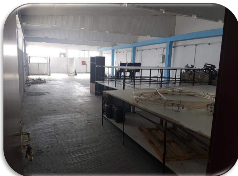
Слика 19: Работна просторија 3