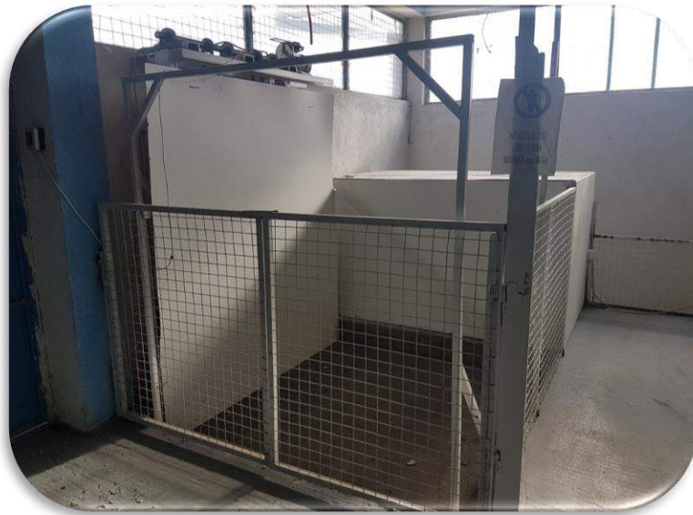
Слика 13: Товарен лифт