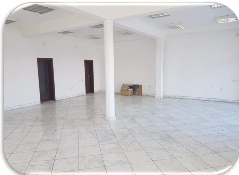
Слика 6: Изложбен салон - поглед од надвор