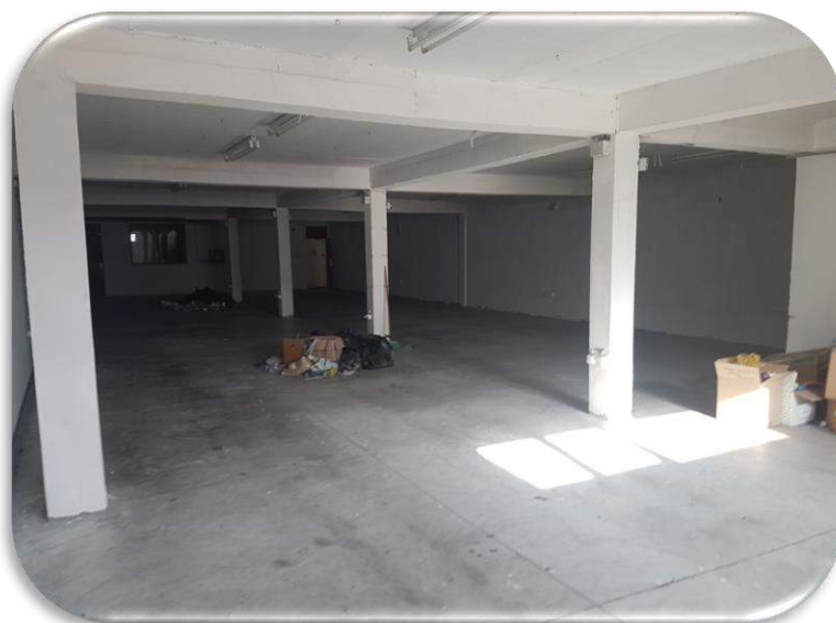
Слика 9: Работна просторија 1