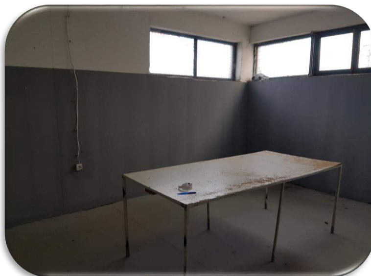
Слика 16: Работна просторија 2