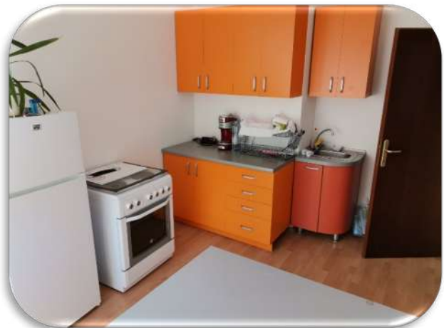
Слика 20 и 21: Канцелариски простор со приемен дел