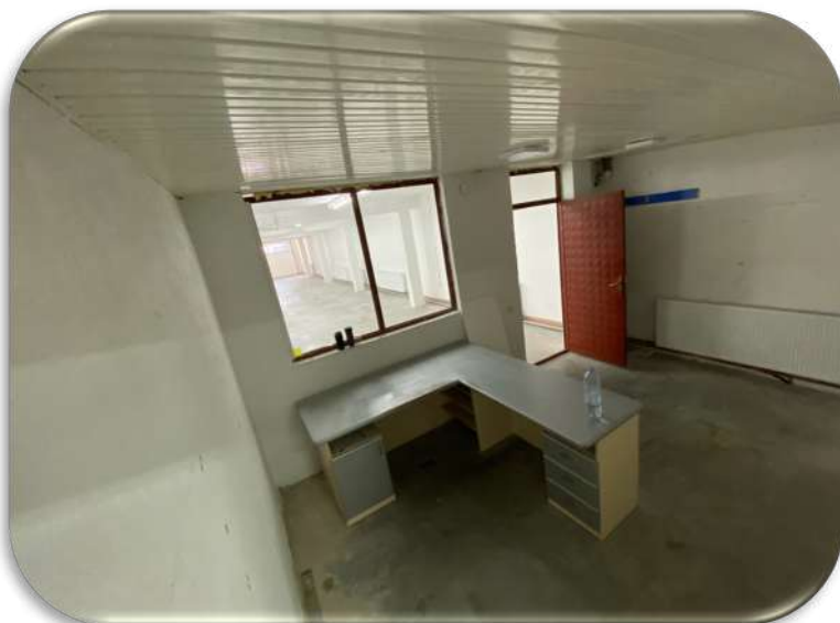
Слика 11: Канцеларијата на работната просторија 1