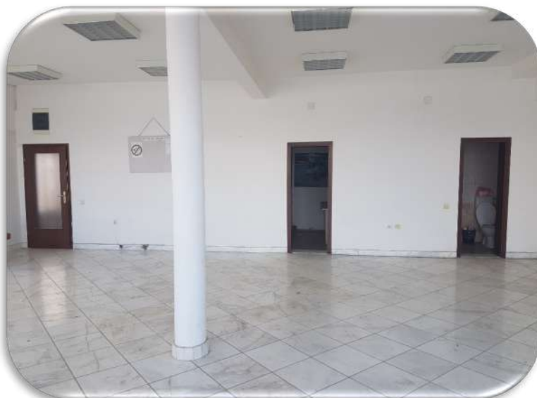
Слика 7: Изложбен салон - помошни простории и пристап до другите делови на објектот