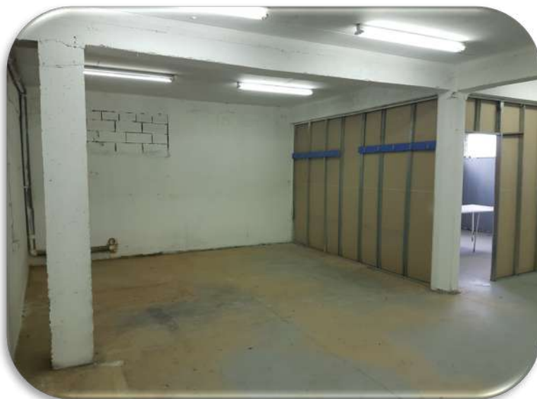
Слика 15: Работна просторија 2