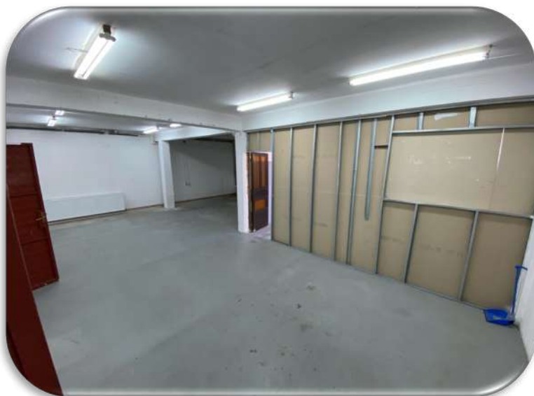
Слика 14: Работна просторија 2

На долниот кат се наоѓа и втората работна просторија која има површина од приближно 100m 2 . Од оваа просторија е достапна канцеларијата на работната просторија 1.