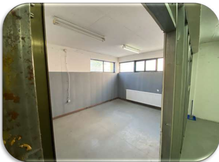
Слика 16: Работна просторија 2