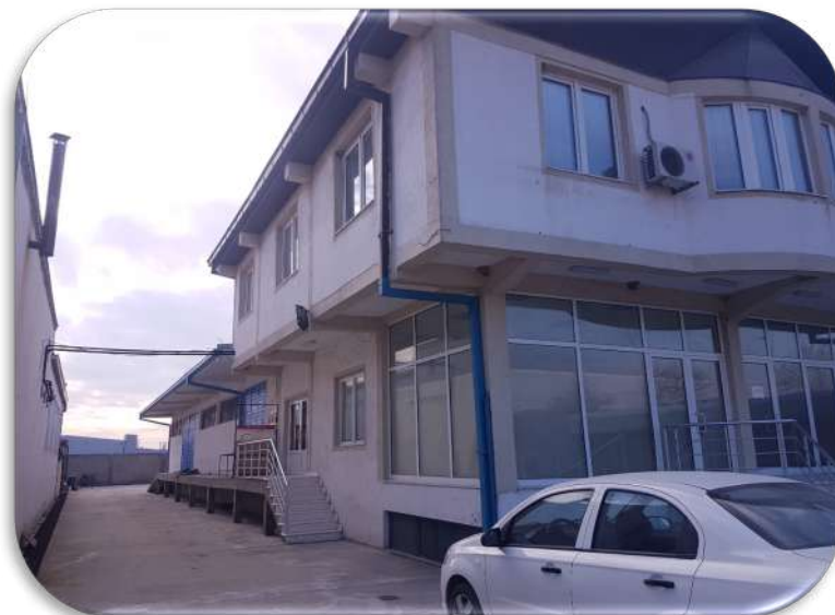
Слика 2: Пристап до задниот дел на објектот