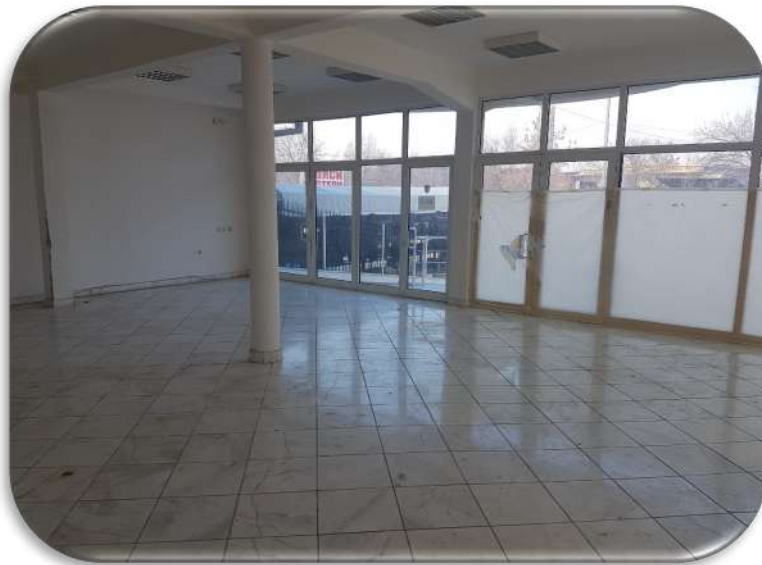
Слика 5: Изложбен салон - поглед кон надвор