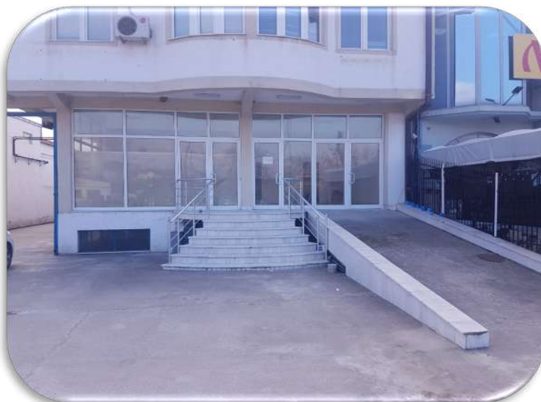
Слика 4: Влез во изложбениот салон

До изложбениот салон се пристапува од надвор и од внатрешноста на објектот. Снабден е и со рампа за полесен пристап на возила.