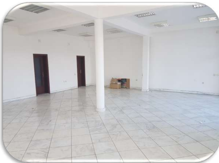
Слика 6: Изложбен салон - поглед од надвор