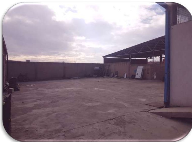
Слика 3: Паркингот што се наоѓа позади објектот