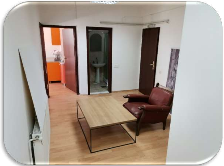
Слика 18 и 19: Канцелариски простор со приемен дел