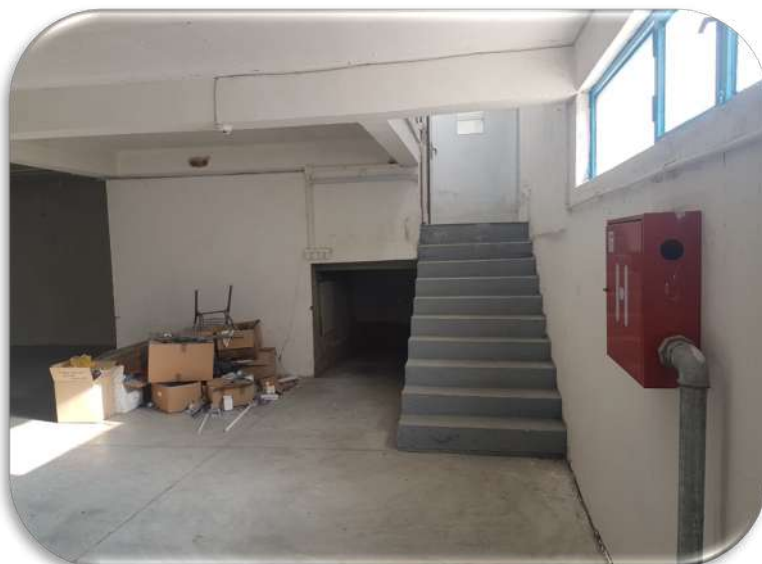
Слика 12: Поврзување на работната просторија 1 со задниот паркинг и тоалетите