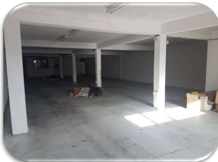
Слика 9: Работна просторија 1