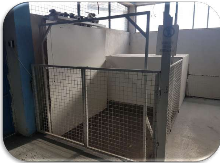
Слика 13: Товарен лифт