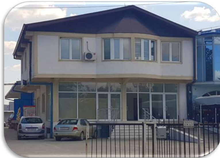
Слика 1: Поглед на објектот и предниот паркинг

Деловниот објект вклучува сопствен двор со паркинг со вкупна површина од 300m 2 . Паркингот е поделен на две парцели кои се наоѓаат пред и зад објектот со површина од 100m 2 и 200m 2 . Двата паркинзи се достапни од главниот влез на објектот.