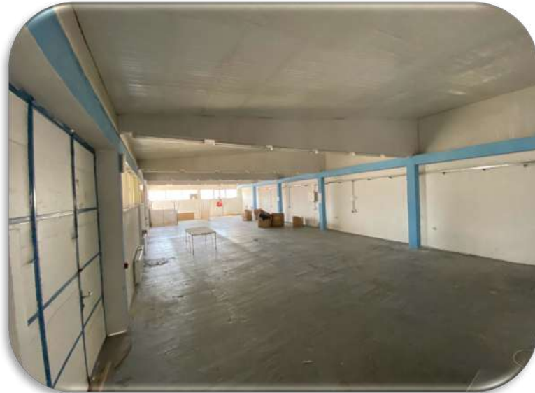
Слика 17: Работна просторија 3

На приземје се наоѓа работната просторија 3 која се простира на површина од 300m 2 . Снабдена е со сопствен тоалет . Оваа просторија поседува два големи индустриски пристапи снабдени со камионски рампи наменети за манипулација на стока кон и од објектот. Поврзана е со работната просторија 1 на долниот кат преку товарниот лифт.