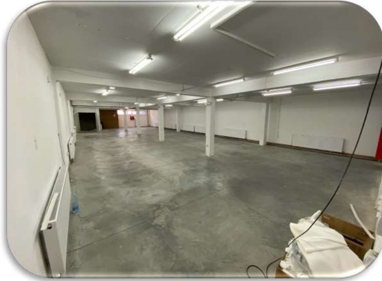
Слика 8: Работна просторија 1

На долниот кат од објектот се наоѓа работната просторија 1 која зазема површина од 300m 2 . Просторијата има тоалети и канцеларија . Канцеларијата е достапна и преку посебен влез. Овој дел на објектот е достапен преку задниот паркинг и од внатрешноста на објектот. Работната просторија 1 и работната просторија 3 (приземје) се поврзани со товарен лифт.